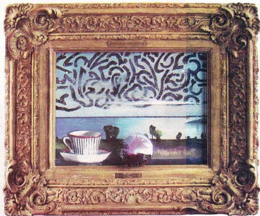
Tidens tecken. En antik ram, en 50-talskopp, och ett evigt landskap.

I alla hans bilder finns berättelser. Som "Fishing for Cochineal", där