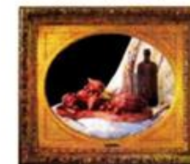
"Vaxmodell #1" (2008).