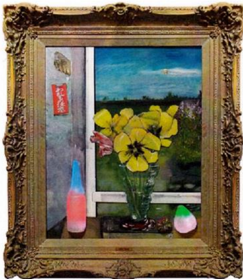
"Ölandsvår" (2007). Kanske som våren ter sig från ett fönster i Hans Froles sommarbostad i Sättra.