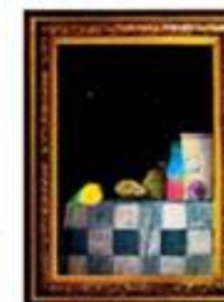
"Sylt" kallar konstnären den här uppställningen.