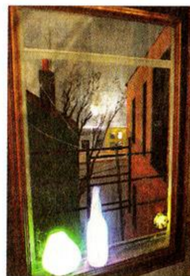
På glänt. Motivet har Hans Frode hämtat från sovrumsfönstret i Brooklyn, New York.