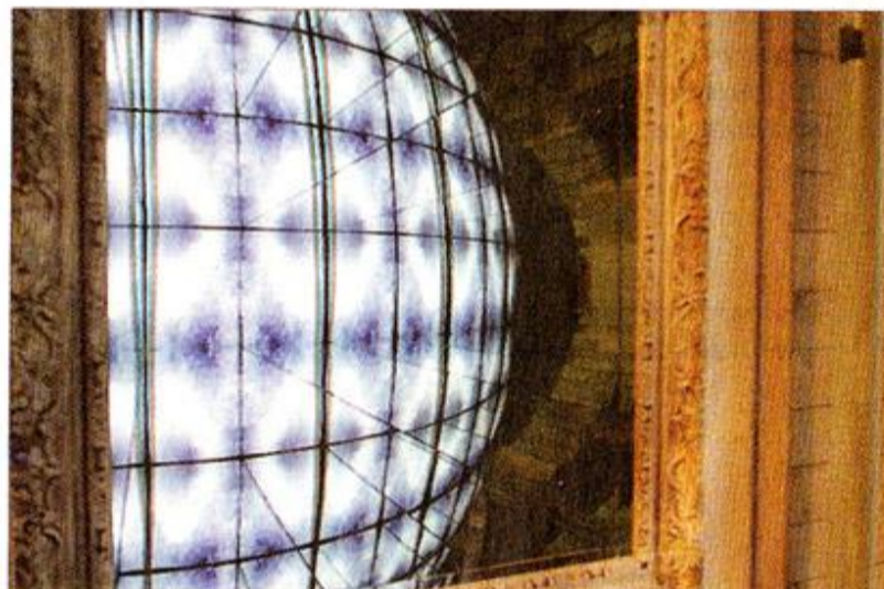
Global effekt. Ett hål i väggen, fyra speglar och en videoskärm. Resultatet blir närmast hypnotiskt.