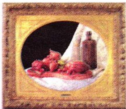
"Vaxmodell # 1" (2008).

– Varje individ upplever bara sitt eget personliga nu, tillvaron består av "Parallel You-niverses", menar konstnären.