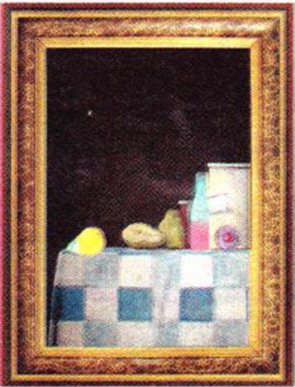
"Sylt" kallar konstnären den här uppställningen.

gångspunkt skapade han ett stillleben och sedan har han fortsatt att skapa på det här omvända sättet, det vill säga att börja med ramen.