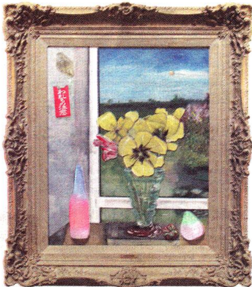
"Ölandsvår" (2007). Kanske som våren ter sig från ett fönster i Hans Frodes sommarbostad i Sättra.