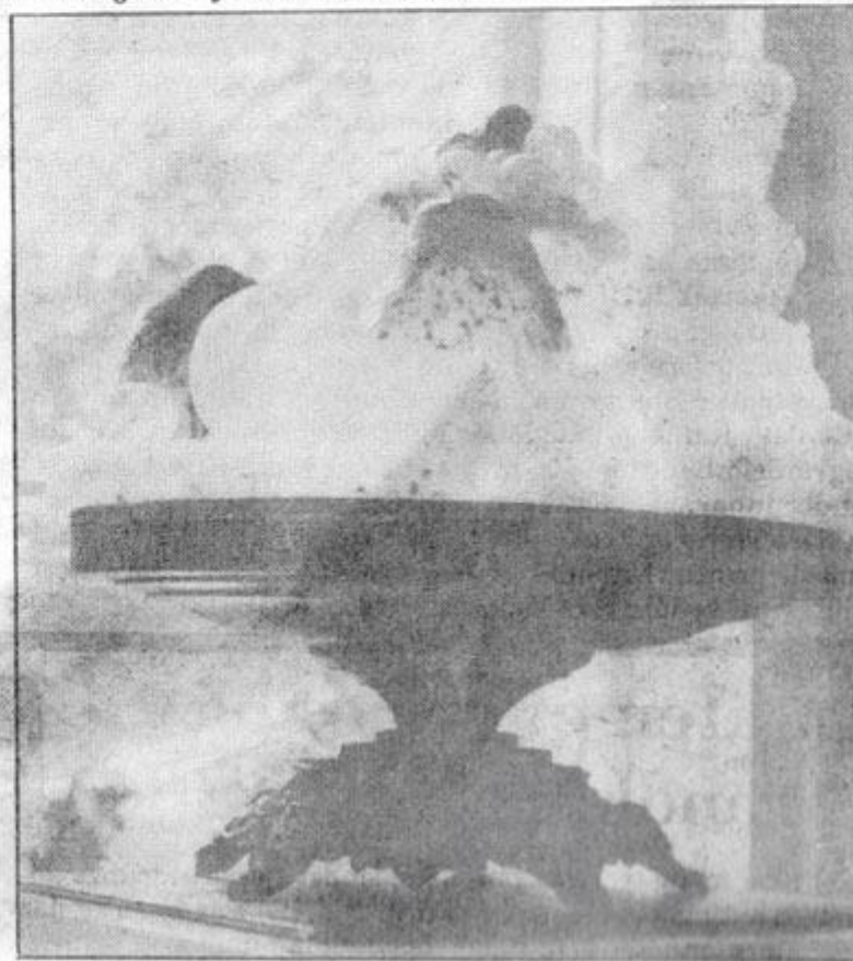
Frostig, skimrande fruktuppläggning Ö la Frode på Galleri Kamras