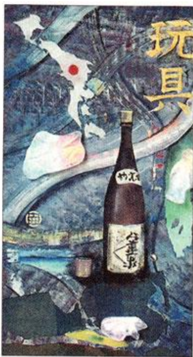
"Att se röken av Japan".