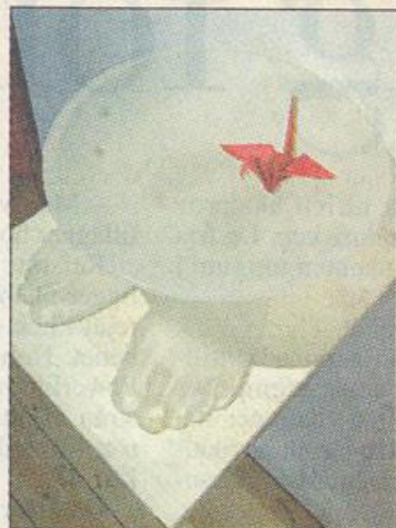
Fötterna på jorden. Tokiko Ishiguros fötter av glas symboliserar individen.